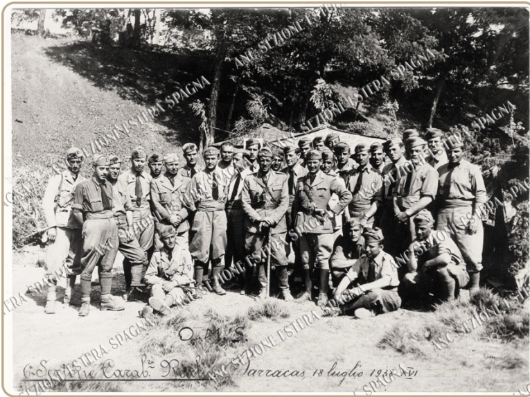
Carabinieri Reali - Campagna di Spagna

La missione, condotta in modo riservato, prevedeva la formazione di un contingente di Truppe Volontarie che, almeno inizialmente, sarebbe stato formalmente assorbito nella Legione Straniera spagnola (Tercio Extranjero). Tale espediente consentiva di aggirare i controlli imposti dal “Patto di non intervento”, sottoscritto da 27 Paesi, evitando di attribuire all’Italia una partecipazione ufficiale e diretta al conflitto.