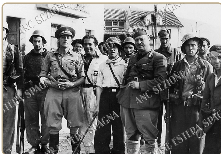
Carabinieri Reali - Campagna di Spagna - Santander

Anche in prima linea i Carabinieri Reali si distinsero, combattendo spesso a fianco delle unità del CTV. Particolarmente rilevante fu il loro contributo nella gestione dei prigionieri di guerra. Durante l'occupazione di Santander, l'improvvisa resa di circa 25.000 soldati repubblicani colse il