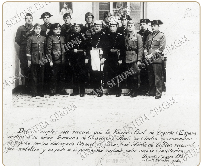
Carabinieri Reali in Spagna - Logroño

Riposino in pace tutti i nostri italiani caduti in terra di Spagna, che ora si trovano uniti e fratelli davanti al cospetto del Padre, Signore nei cieli.